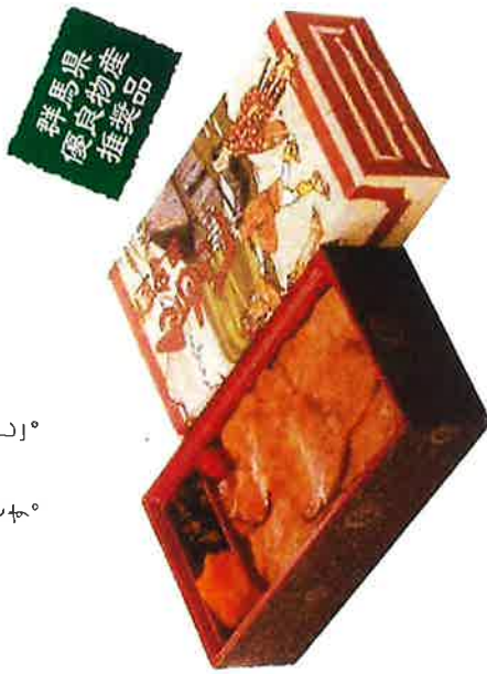
上州御用 鳥めし 竹弁当

秘伝のたれと厳選された鳥肉で創業当初から 人気を博している「烏重」を気軽に テイクアウトできるようにした「上州御用鳥めし」。 若手の技と心意気が息づくその味は、 県内をはじめ多くの皆様に愛される上州名物です。